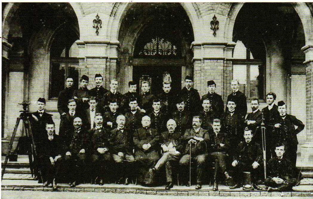
Pracownicy i absolwenci Szkoły Górniczej w Tarnobrzegu