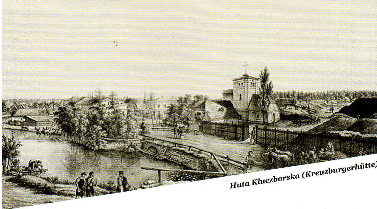
Huta Kluczborska (Kreuzburgerhütte)