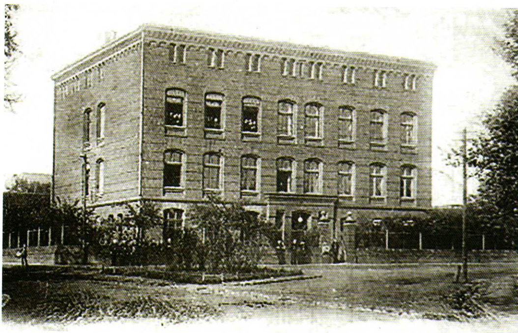
Drugi i ostatni budynek Szkoły Górniczej w Tarnowskich Górach

Mimo iż 58% tarnogórzan, uprawnionych do głosowania, oddało w plebiscycie swe głosy dla Niemiec, Genewa przyznała to górnicze miasto Polsce. Szkoła, w zależności od obywatelstwa słuchaczy, musiała zostać rozdzielona na część polską i niemiecką. Wojewoda zarządził