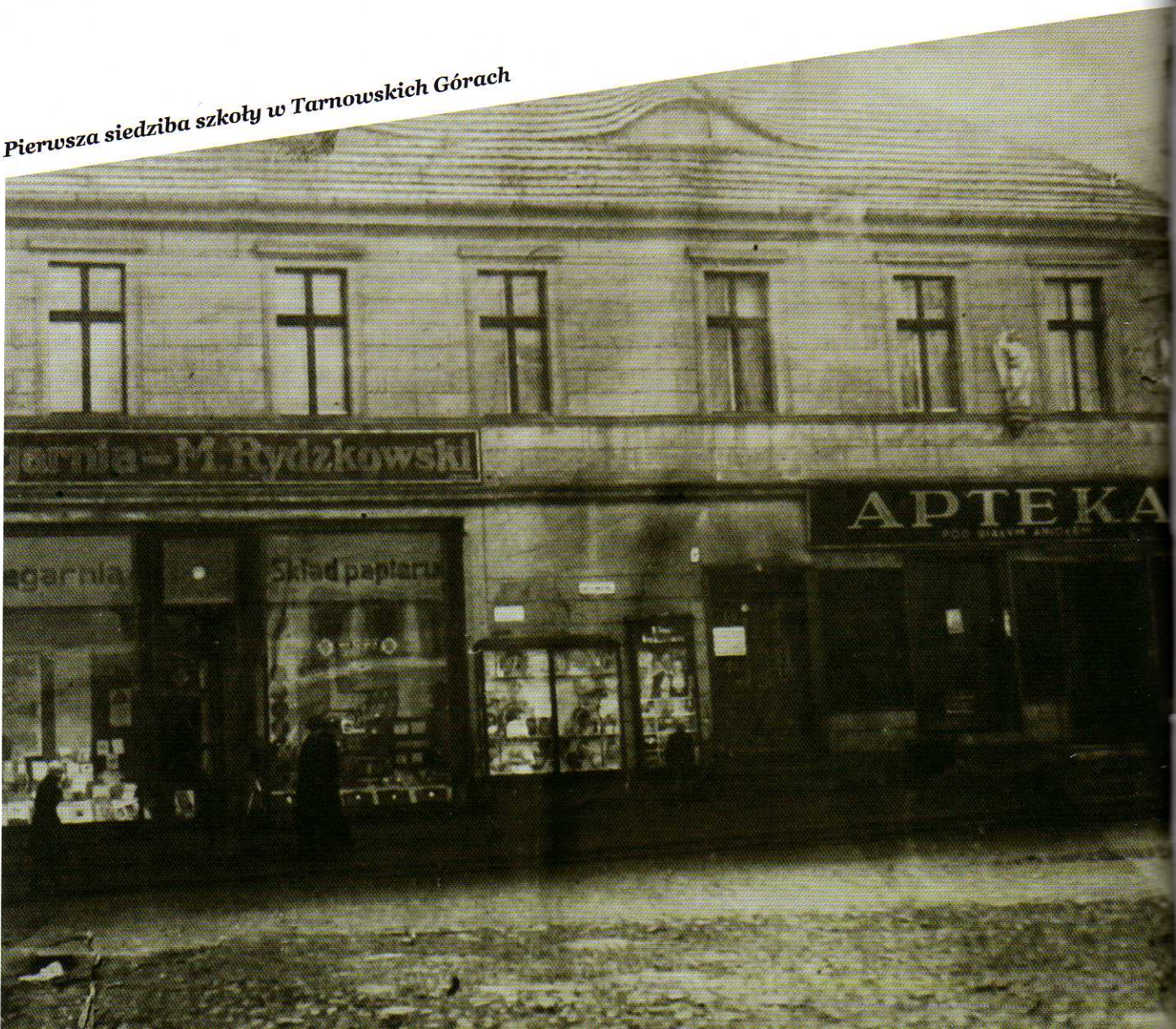
Pierwsza siedziba szkoły w Tarnowskich Górach