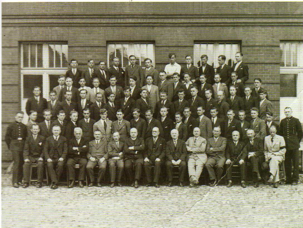
Ostatni absolwenci Szkoły Górniczej w Tarnowskich Górach