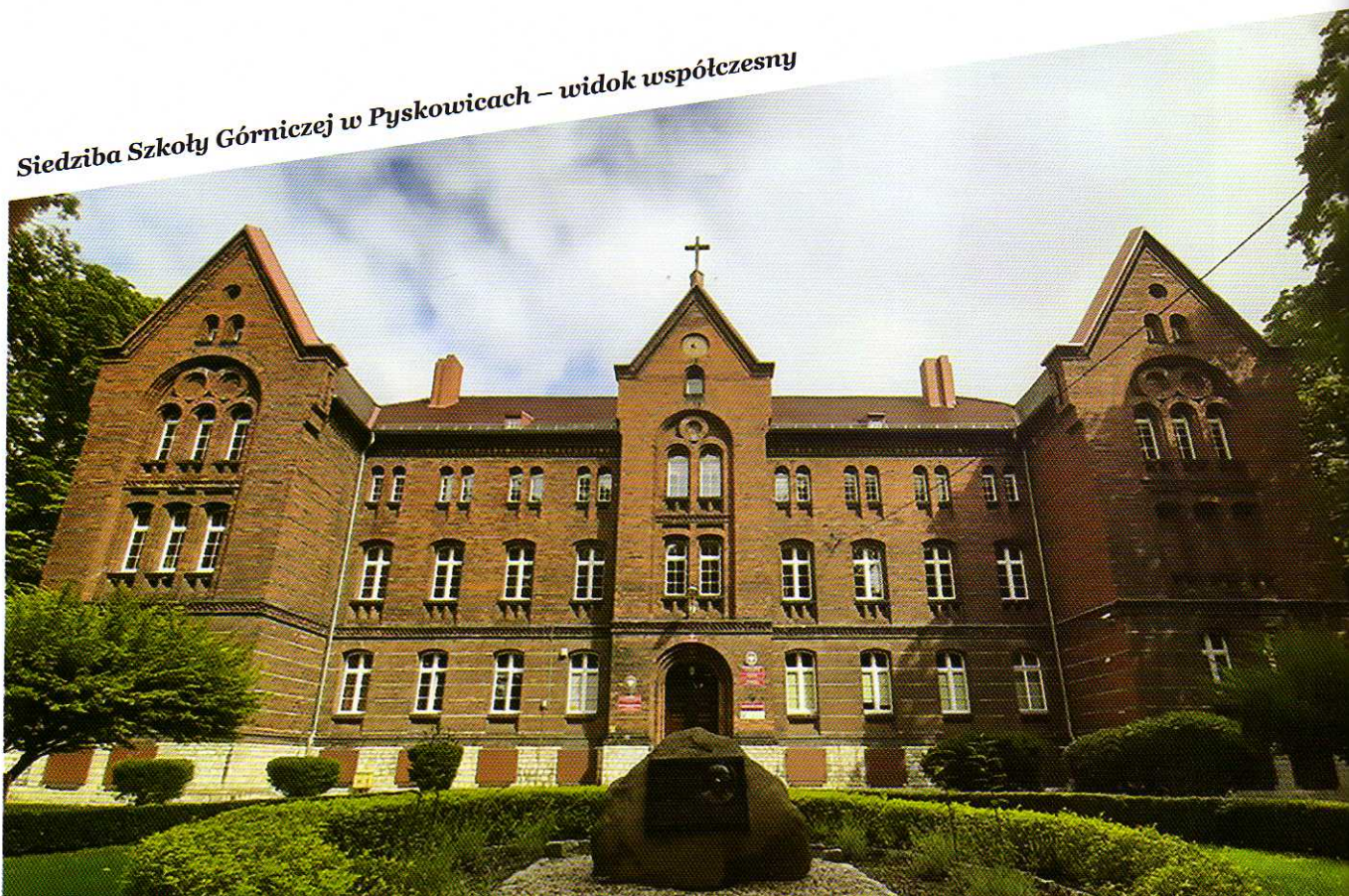
Siedziba Szkoły Górniczej w Pyskowicach – widok współczesny

Wraz z początkiem roku szkolnego 1924/1925 dwa niemieckie kursy przeniesiono z Tarnowskich Gór do Pyskowic. Uroczystość otwarcia szkoły nastąpiła 12 sierpnia 1924 roku w obecności przedstawicieli Związku Szkół Górniczych, władz górniczych oraz administracji państwowej i miejskiej. Szkoła Górnicza w Pyskowicach prowadziła swą działalność do 1945 roku, zaś szkoła w Tarnowskich Górach do 1933 roku. Niedługo później całkowicie zlikwidowano Szkołę Górniczą w Tarnowskich Górach, a nową uruchomiono w Katowicach.