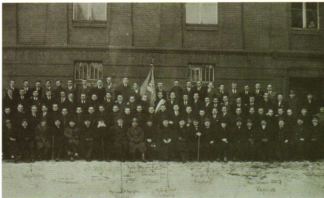
Pracownicy i absolwenci Szkoły Górniczej w Tarnowskich Górach