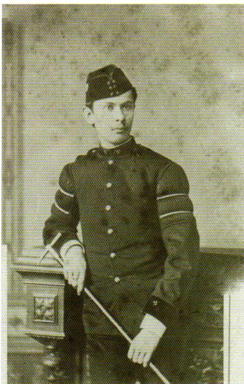
Absolwent Szkoły Górniczej w Wieliczce