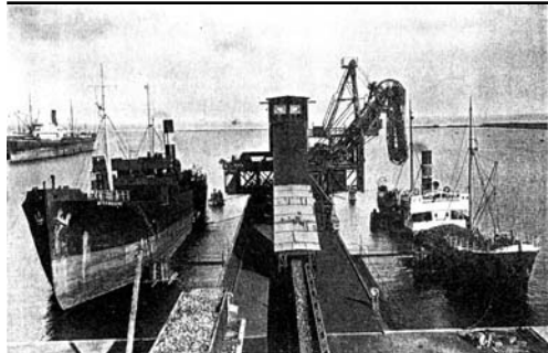
Urządzenie przeladunkowe „Skarbopolu” w porcie w Gdyni.

w Knurowie. Koncern był pierwszym producentem węgla w Polsce, aż do czasu, gdy wyprzedziła go utworzona w 1929 r. Wspólnota Interesów Górniczo-Hutniczych S.A. Choć formalnie spółka „Skarboferm” została założona 25 II 1922 r., porozumienie w sprawie jej utworzenia zostało podpisane jeszcze przed plebiscytem na Górnym Śląsku, mianowicie 1 III 1921 r. 13 w Paryżu. Było ono wyrazem koncesji gospodarczych poczynionych przez rząd polski na Górnym Śląsku dla przemysłu francuskiego, w zamian za poparcie Francji dla sprawy polskiej przynależności państwowej Górnego Śląska 14 .